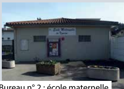
Bureau n° 2 : école maternelle du Vigneron 17, rue Maréchal Leclerc