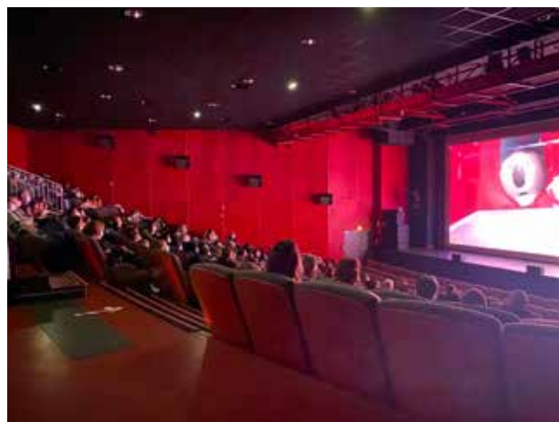
Forte fréquentation pour le ciné à prix mini !

Depuis le mois de novembre, le Quarto travaille également avec le programmateur Véo qui, riche de son réseau, permet de recevoir des avant-premières et sorties nationales très régulièrement. Depuis son entrée dans le réseau, plusieurs films en avant-premières ont été diffusés tels que Clifford , Les Tuche 4 ou encore Tous en scène 2 !