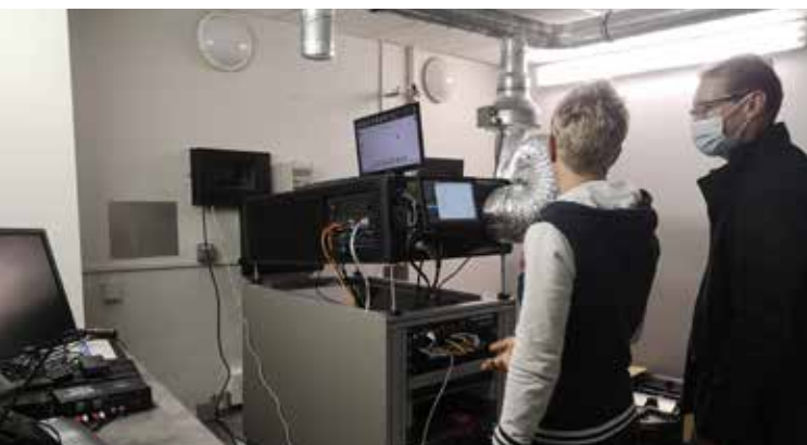
Présentation du nouveau projecteur

projecteur laser dernière génération 2K permet d'offrir un confort exceptionnel durant la projection.