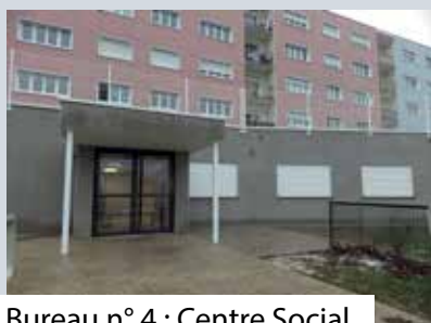
Bureau n° 4 : Centre Social d'Unieux 11, rue Salvador Allende