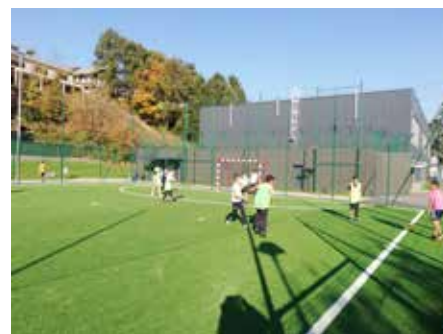
Terrain de futsal extérieur