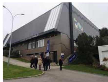
Inauguration de la rénovation thermique des façades du gymnase Anatole France