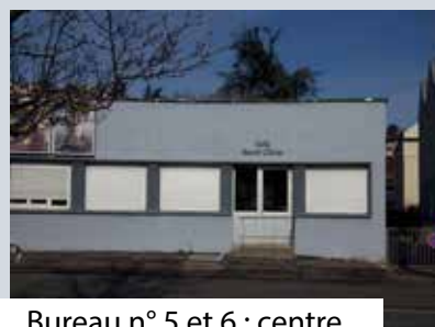
Bureau n° 5 et 6 : centre urbain de Côte-Quart (salle Benoît Olivier et hall du Quarto) 5, rue Jean Jaurès