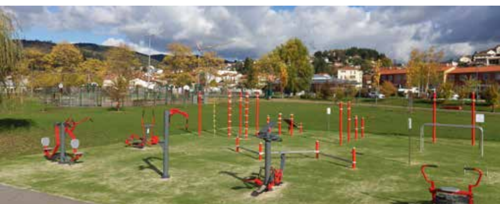
Appareils de musculation en libre accès au Parc Nelson Mandela