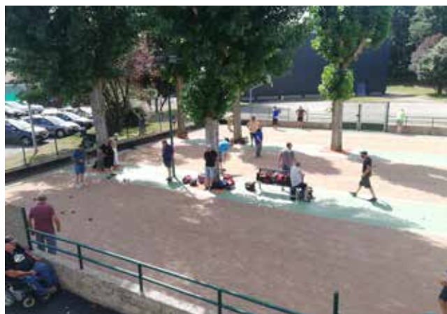
Jeu de boules au PLCQ