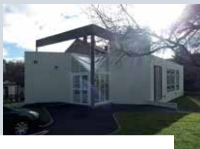
Bureau n° 1 : Claj Place Charles Crouzet