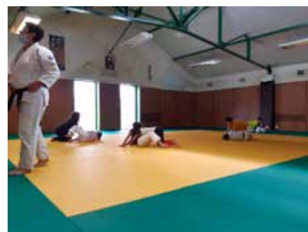
Dojo de l'Espace Rural d'Animations (ERA)