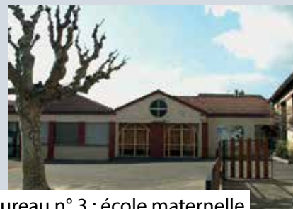
Bureau n° 3 : école maternelle du Bourg 19, rue Jean Moulin