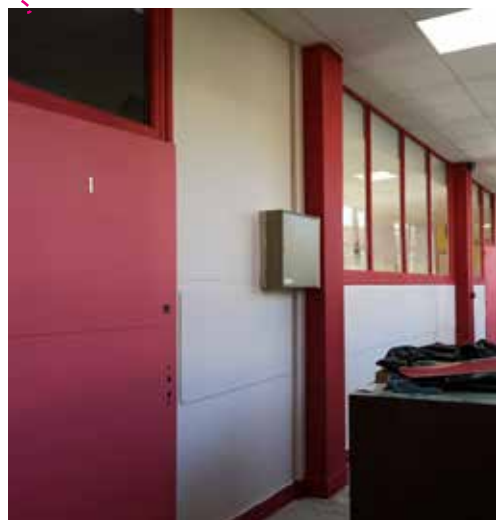
Réfection d'un couloir à Côte-Quart

En maternelle, pour améliorer la sécurité des élèves, les portes d'accès aux salles de classes du rez-de-chaussée et le châssis d'accès à la cour de récréation ont été remplacés par des matériaux en aluminium isolant.