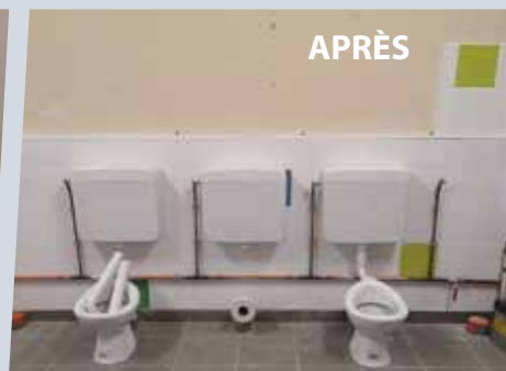
Sanitaires de la maternelle du Bourg