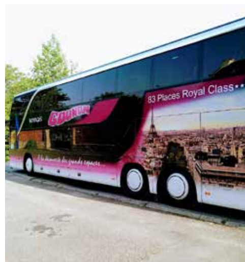
Un grand bus tout confort !

Les séniors sont prêts pour 2020 où une nouvelle destination sera proposée !