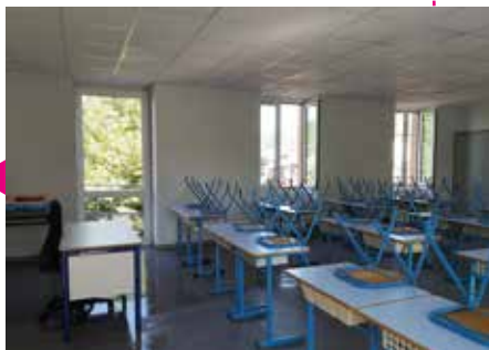
Rafraichissement d'une salle de classe au Vigneron

En outre, l'arrivée de la classe Ulis en septembre et la réouverture de la 3 e classe de maternelle au Vigneron a impliqué des travaux et l'acquisition de matériel et de mobilier. De plus, la rénovation des sanitaires en maternelle et en élémentaire est programmée pour les vacances de Toussaint. Les salles de la cantine ont également été rafraîchies.