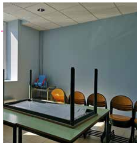
Rafraichissement des salles de cantine au Vigneron

À Côte-Quart, les luminaires existants ont été remplacés par des luminaires à LEDs, permettant d'importantes économies d'énergie (-40 % sur 120 équipements). L'isolation de l'ensemble des plafonds de l'école primaire permet d'améliorer l'isolation énergétique et phonique. La réfection d'un couloir est venue compléter cet ensemble de travaux.