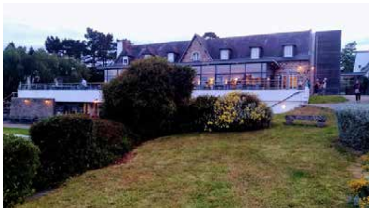
Le village vacances à Port-Manech

Face à l'océan, Port-Manech est situé au sud Finistère, à l'embouchure de l'Aven. Haut lieu de villégiature à la Belle Époque, Port Manech est un village riche d'histoire et un site idéal pour la découverte de la Bretagne. Les participants ont pu goûter aux charmes de cette région à la fois mystérieuse et fascinante grâce à un programme varié et équilibré.