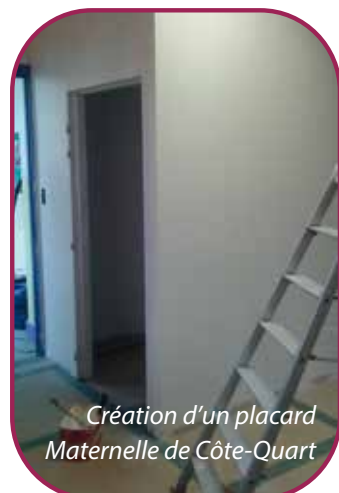
Création d'un placard Maternelle de Côte-Quart

D'autres travaux ont aussi été réalisés comme la création de placards, des changements de portes, la pose de rideaux pour la maternelle de Côte Quart .