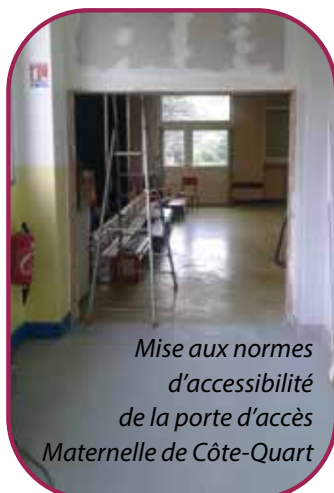
Mise aux normes d'accessibilité de la porte d'accès Maternelle de Côte-Quart