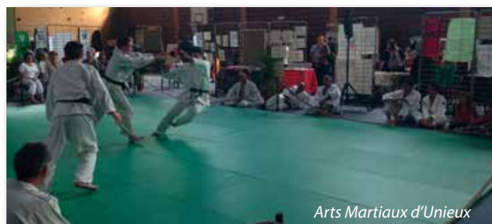
Arts Martiaux d'Unieux

Par ailleurs, la municipalité participe à la prise de licence pour les jeunes Unieutaires de 5 à 20 ans à hauteur de 15 euros. Renseignements : Fabrice Cordat ou Véronique Romeyer - 04.77.40.30.80.