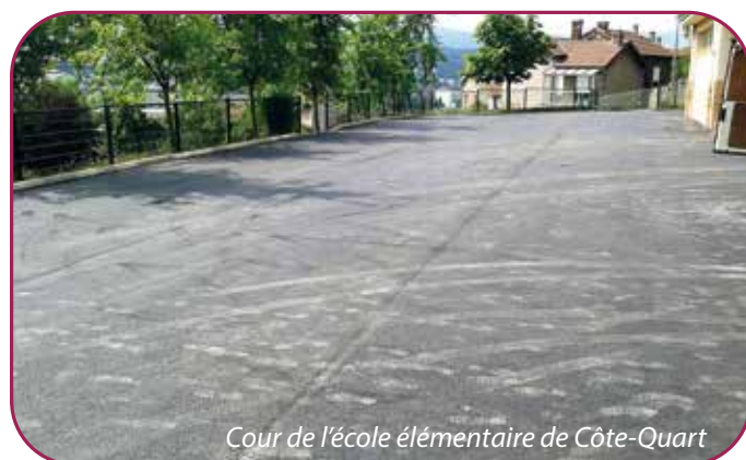
Cour de l'école élémentaire de Côte-Quart

Les enfants de l'école élémentaire de Côte Quart bénéficieront d'une cour de récréation qui a connu une cure de jouvence avec la mise en place d'un nouvel enrobé pour la sécurité des nombreux enfants.