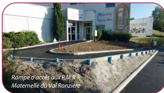
Rampe d'accès aux P.M.R Maternelle du Val Ronzière