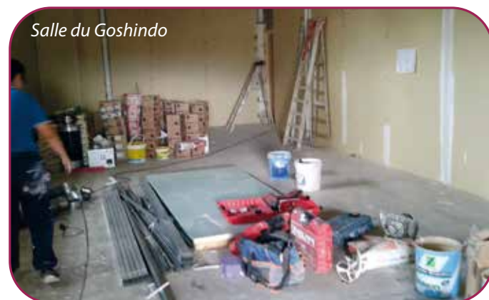
Salle du Goshindo

Dans l'enceinte du groupe scolaire de Côte-Quart, la salle qui sert à l'association Goshindo également utilisée par l'école dans le cadre d'activités diverses et des T.A.P a été rénovée. Du sol au plafond en passant par la lumière et le chauffage, l'ensemble des locaux a été remis à neuf pour le plus grand plaisir des différents utilisateurs.