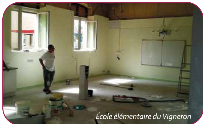
École élémentaire du Vigneron