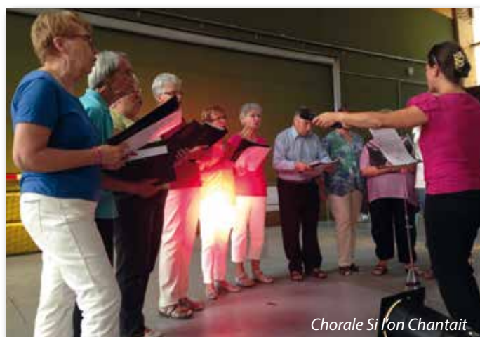
Chorale Si l'on Chantait

Certaines associations existent depuis de nombreuses années, 100 ans pour certaines ! D'autres, plus récentes sont en plein essor. Leur diversité permet à chacun, petits ou grands, jeunes ou moins jeunes, de trouver l'activité qui lui convient ou lui ressemble. Dans chacune d'entre elles, les nombreux bénévoles s'investissent sans compter pour assurer la dynamique de leurs activités. La vie associative joue pleinement son rôle social sur la commune. Certaines associations n'hésitent pas à s'investir et à participer régulièrement aux diverses animations de la commune en plus de leurs nombreuses activités.