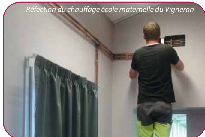
Réfection du chauffage école maternelle du Vigneron