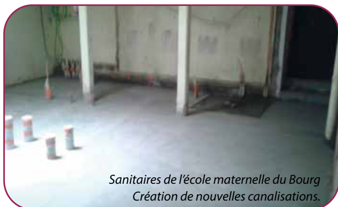
Sanitaires de l'école maternelle du Bourg Création de nouvelles canalisations.

Un chantier important a eu lieu à l'école maternelle du Bourg . La création de nouvelles canalisations devrait permettre de résoudre des problèmes d'évacuations et d'apporter un confort supplémentaire aux enfants et aux personnels. Dans le cadre de ces travaux, un W.C accessible aux Personnes à Mobilité Réduite a été créé.