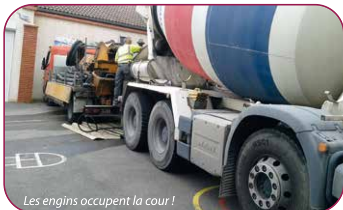
Les engins occupent la cour !

L'école du Val Ronzière a bénéficié du changement de mobilier dans trois classes.