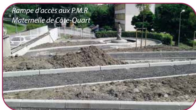
Rampe d'accès aux P.M.R Maternelle de Côte-Quart

Début 2016, elle a été consultée sur l'agenda d'accessibilité programmée (Ad'Ap).