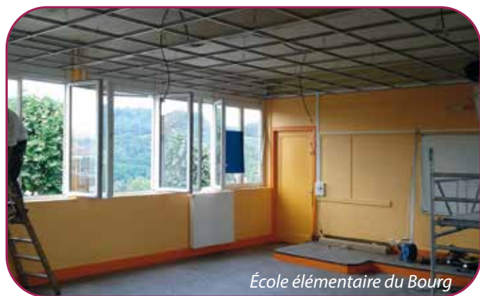
École élémentaire du Bourg

Dans le cadre de l'amélioration des performances énergétiques des bâtiments communaux, un nouveau système de chauffage a été installé à l'école maternelle du Vigneron . Par ailleurs, afin d'assurer la sécurité des élèves, la mise en place de barrières limitera le stationnement devant l'entrée de cette école.